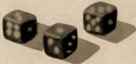
Die Würfel sind gefallen: Was Nick fand, war nicht Reichtum — es war Tod